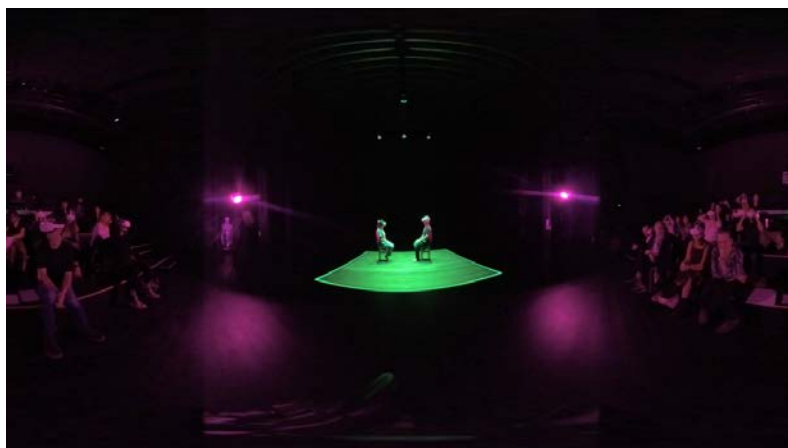
TEST PUBLIC RÉALISÉ AU LIEU UNIQUE- LA LIBRE USINE - EN JUIN 2022