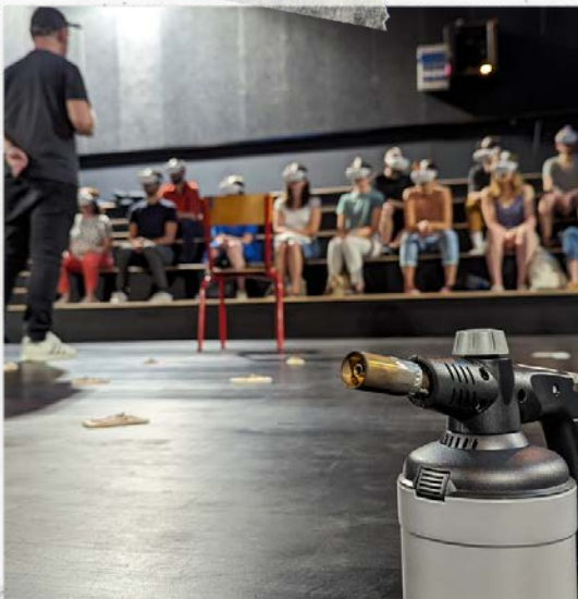
Test Public - La Libre Usine - Expérience du chalumeau.