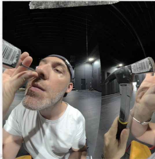
Prototype de vidéo de fakirisme en 180° stéréoscopique testée en public "le clou dans le nez" afin d'appréhender l'UX. (résidence 5)