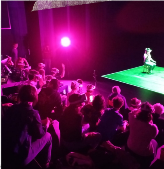
Premiers tests de mise en réseau des casques en situation #4 La Libre Usine