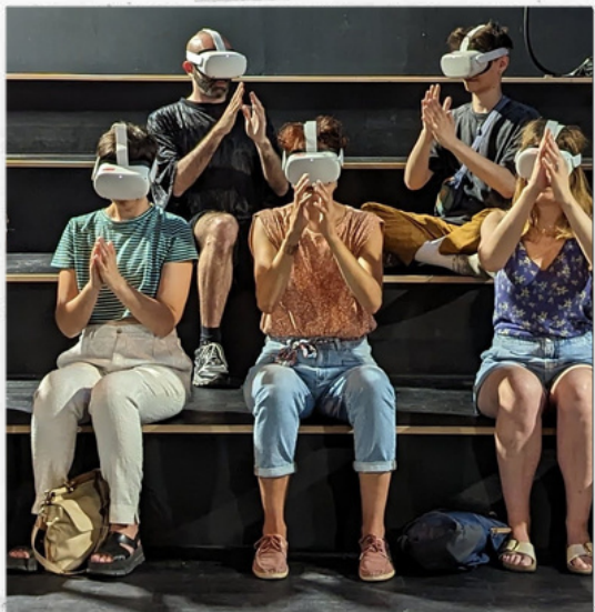
Session de tests pour l'élaboration d'une méthode de calibration technique des casque sans que le spectateur s'en rende compte.